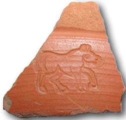
Graffiti au cheval Terre cuite - II e /V e siècle découvert dans le sondage de la place des 4 ormeaux, 2017.

Une exposition pour remonter le temps et revivre 2000 ans d'événements qui ont marqué l'histoire de la place Carnot... et de la ville.