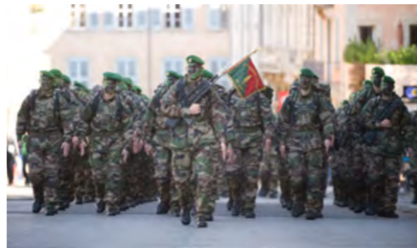
LE 2 e REG POUR LE 11 NOVEMBRE - Pour la commémoration de l'armistice du 11 novembre 1918, des soldats du 2 e régiment étranger de génie ont défilé entre la place de la Bouquerie et le monument aux morts. En tenue de combat, les hommes ont été chaleureusement applaudis par la foule au moment de rejoindre les autorités civiles et militaires, boulevard National.