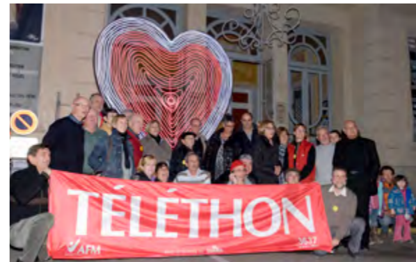
LE 25 e TÉLÉTHON - Trois nouvelles associations ont participé au Téléthon cette année : le Cercle Provençal, Chœur Domitia et la Mascarade qui ont rapporté au total 1 225 €. Notons la performance du Chœur Domitia avec 627 €. La générosité a été beaucoup plus forte que l'an dernier : 13 500 € contre 10 500 €. Le Lions Club, maître d'œuvre, contribue pour 20 % du total, à travers les activités qu'il a proposées. Le collectif remercie les vingt-cinq associations aptésiennes qui ont contribué à ce succès. Au plan national, plus de 86 millions d'euros de promesses de dons ont été collectés.