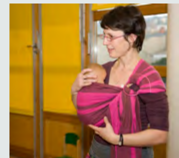
PORTER SON BÉBÉ - L'association Naître en pays d'Apt organise régulièrement des ateliers de portage du bébé en écharpe. Maintenir la fusion avec lui, comprendre ses réactions, le rassurer... sont quelques uns des avantages exposés par les conseillers. L'atelier a notamment lieu à la maison de la petite enfance, un samedi par mois. Inscriptions : 06 70 94 06 96.