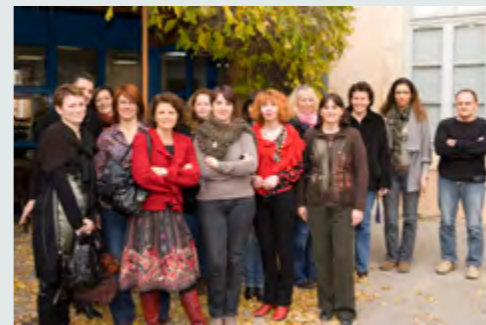
FORMATION SANTÉ - La mairie d'Apt s'implique dans les questions de santé publique et de prévention. Avec ses partenaires, elle a décliné des actions toute l'année 2011. Dix-huit professionnels se sont retrouvés à la maison de la Boucheyronne, début décembre, pour suivre une formation de deux jours sur la prévention du suicide des jeunes. Le but est de former des « personnes-ressources », capables de repérer, de dialoguer et d'orienter rapidement tout sujet à risque. Les stagiaires travaillent notamment au collectif Ariane, à la Mission locale, à l'ANPEP, au CMS, au CCAS, au CAPA, à la Maison Bonhomme et à l'hôpital d'Apt. En février, septième rencontre prévention suicide pour le Vaucluse. Rens. : CCAS - 04 90 04 36 60.