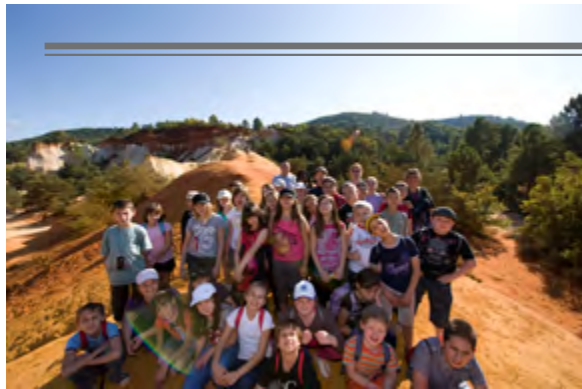
VISITE DES PETITS BELGES DE BOUSSU-HORNU - Mi-octobre, des écoliers belges de Boussu-Hornu, la ville jumelée avec Apt, sont venus passer une semaine en compagnie de leurs enseignants. Logés à la maison de la Boucheyronne, ils ont visité la région et moissonné plein de souvenirs.