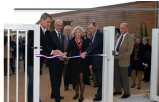
LES LOGEMENTS D'URGENCE DE L'HAPA - En présence des élus, les nouveaux locaux de l'Hébergement Accueil en pays d'Apt viennent d'être inaugurés. Ils remplacent de vieux préfabriqués avec un espace de vie plus important pour recréer du lien entre les résidents. Le projet a pu voir le jour grâce au mécénat d'entreprise, au soutien financier de nombreux partenaires et de la ville d'Apt.