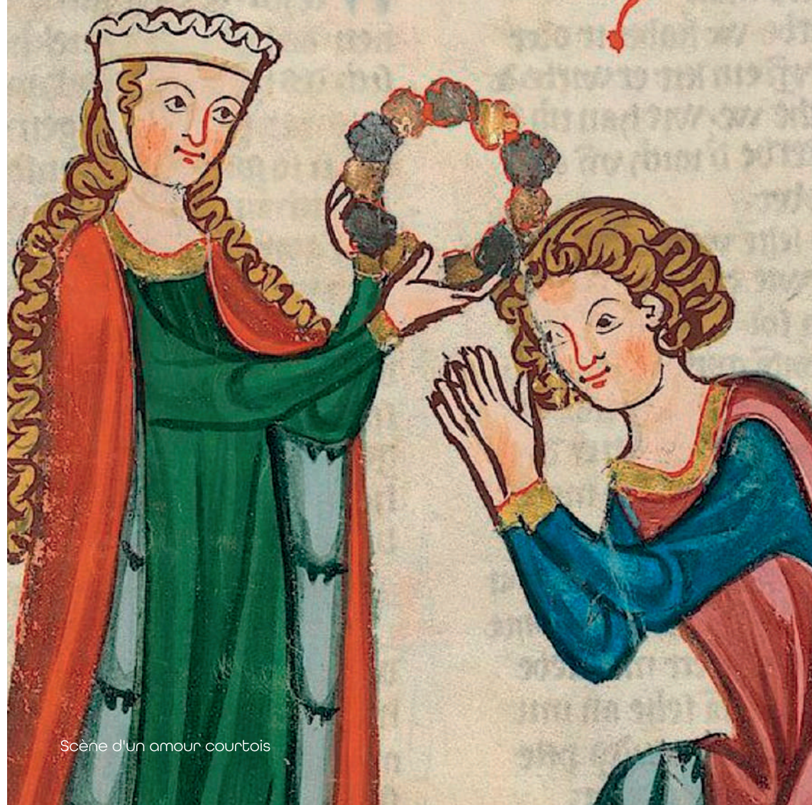
Scène d'un amour courtois