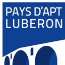
PAYS D'APT LUBERON