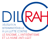
DILRAH DÉLÉGATION INTERMINISTÉRIELLE À LA LUTTE CONTRE LE RACISME, L'ANTI-SÉMITISME ET LA HAÏNE ANTI-LGBT