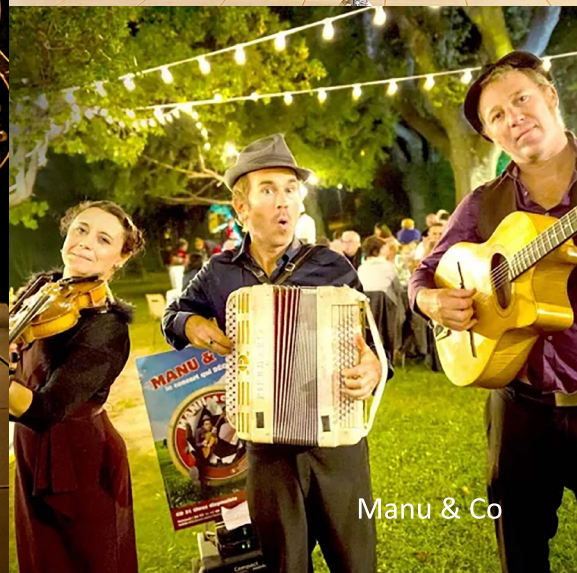
Manu & Co