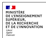
MINISTÈRE DE L'ENSEIGNEMENT SUPÉRIEUR, DE LA RECHERCHE ET DE L'INNOVATION Liberté Égalité Fraternité