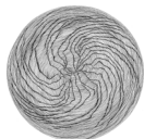
Le son des pierres