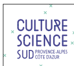
CULTURE SCIENCE SUD PROVENCE-ALPES CÔTE D'AZUR