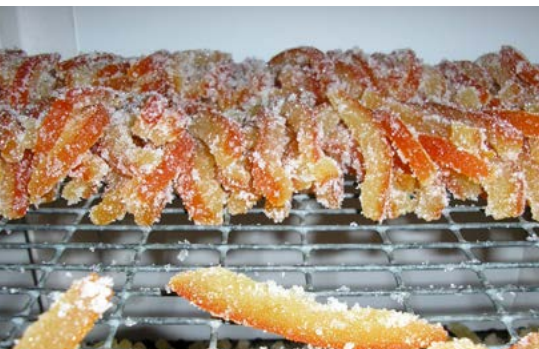
Le Galapian, spécialité du Pays d'Apt

16h30 - Visite guidée gratuite autour des faïences au Musée de l'Aventure Industrielle, place du Postel .