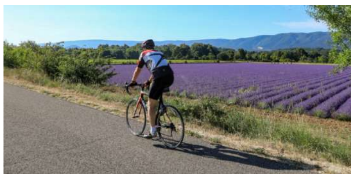
Champs de lavande - un cadre sensationnel pour les activités extérieures

Promotion du tourisme à vélo dans le Luberon