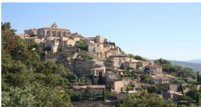
Gordes - l'un des Plus Beaux Villages de France du territoire

La ville d'Apt n'est pas qu'un décor de carte postale. C'est un territoire vivant à découvrir à seulement 45km d'Aix-en-Provence, 55km d'Avignon, et 65km de Marseille.