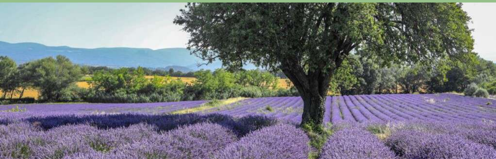
Paysages de Provence - champs de lavande du Luberon traversés par le peloton

Barbentane → Apt : 179,3 km · 2 100 m D+