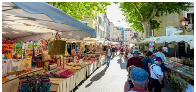
Marché d'Apt - classé dans les 100 plus beaux de France