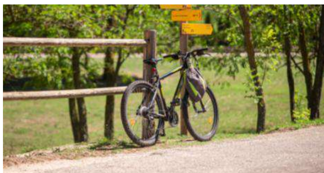
Véloroute - relie les villes d'Apt, de Cavaillon et de Forcalquier

Pour les plus sportifs, les routes départementales offrent des parcours variés à travers les vignobles, les champs de lavande et les villages perchés.