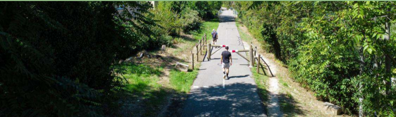
Cyclisme dans le pays d'Apt — un terrain de jeu exceptionnel pour tous les niveaux