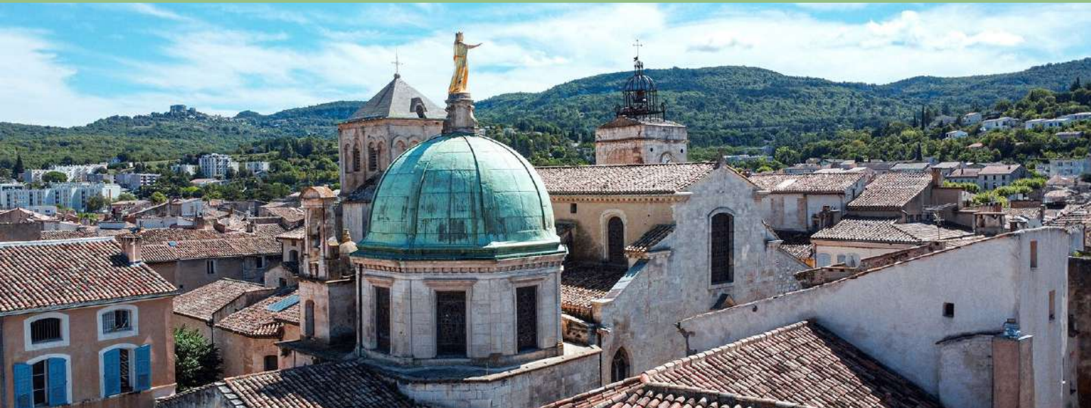
Apt - Capitale du Luberon, sous-préfecture du Vaucluse, 2 000 ans d'histoire

Ville d'arrivée · Vaucluse (84) · 84400 · Sous-préfecture