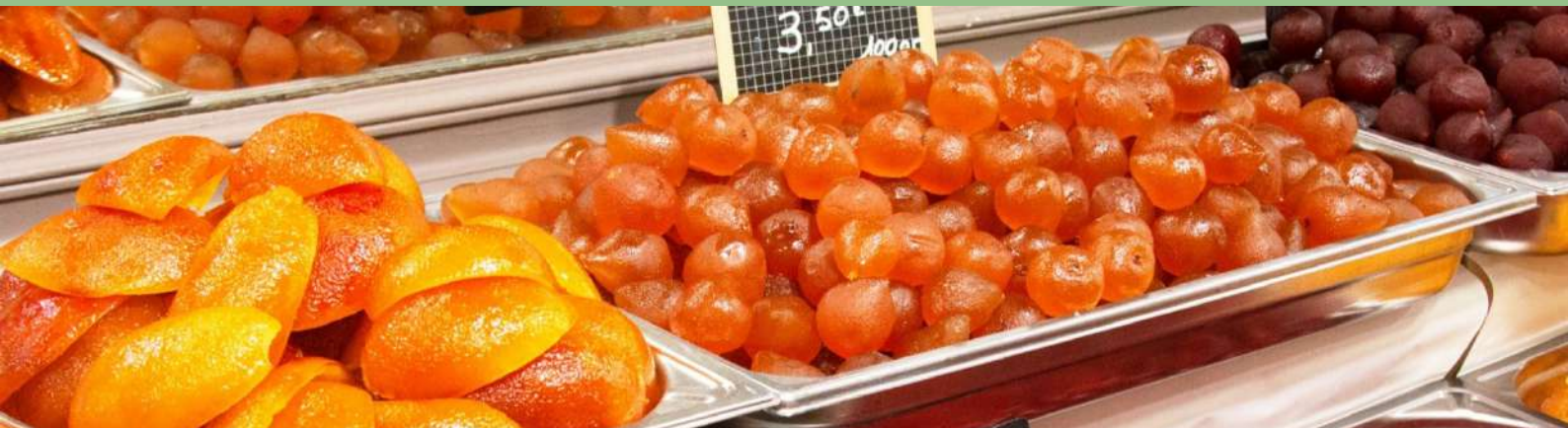
Apt - « Capitale mondiale du Fruit confit »

L'identité provençale d'Apt — Terroir, artisanat et gastronomie