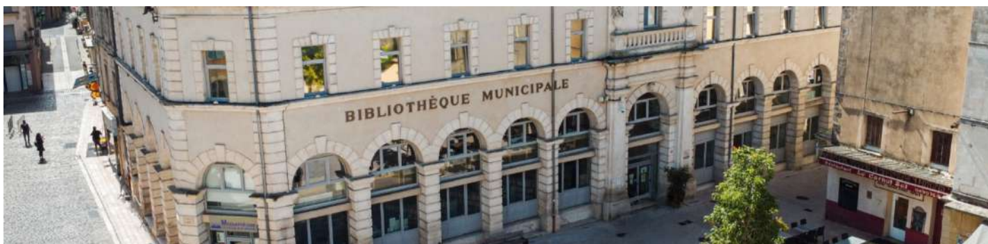
Apta Julia - cité Fondée par les Romains entre 45 et 30 av. J.-C

En 1660, la reine Anne d'Autriche visite Apt pour remercier Sainte Anne de la naissance de Louis XIV. Les habitants lui offrent dragées et confitures sèches, prémices de la future renommée d'Apt comme capitale des fruits confits