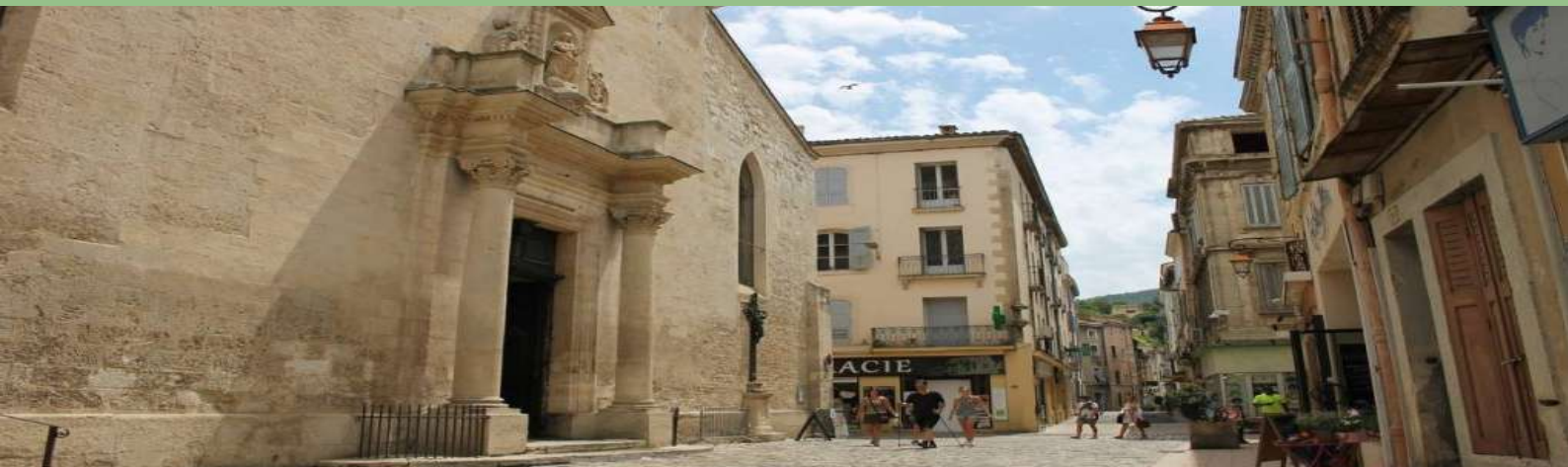
Cathédrale Sainte-Anne d'Apt - achevée au XII e siècle, chapelle royale depuis 1660

Créée par les Romains sous le nom « Apta Julia », la ville abrite une histoire vieille de 2000 ans dont elle conserve la mémoire et les traces dans son architecture et son patrimoine. Son centre historique gravite autour de la cathédrale Sainte-Anne, monument historique classé, dont les fondations reposent sur des vestiges romains.