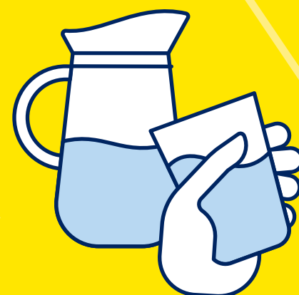
BUVEZ DE L'EAU